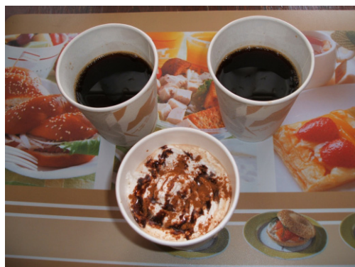
本格派コーヒー ほろ苦ブレンド 250 円 カプチーノ(甘・苦) 300 円 冷コーヒー(すきっと苦味) 300 円

坂東には坂東の力がある。郷に入っては郷にしたがえ。 坂東にも疲れをいやす本格派のコーヒー有ります。