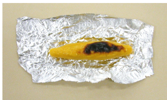
すいととぼてと 250 円 (紅東とげん格卵を使って焼き あげました)